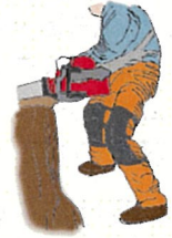
（図7）下肢の切創防止用保護衣

〈注意1〉（図7）で例示した下肢の切創防止用保護衣は、前面にソーチェーンによる損傷を防ぐ保護部材が入っており、JIS T8125-2に適合する防護ズボン又は同等以上の性能を有するものを使用してください。また、労働者の身体に合ったサイズのものを着用してください。既にソーチェーンが当たって繊維が引き出されたものなど、保護性能が低下しているものは使用しないようにしてください。