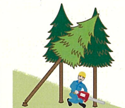
(図3) かかっている立木の伐倒