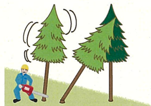
(図4) かかり木に激突させるためにかかり木以外の立木の伐倒