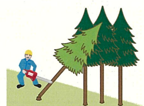
(図5) かかっている木の元玉切り