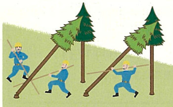
(図2) かかり木の処理

<注意> 「かかっている木の元玉切り」(かかった状態のまま元玉切りをし、地面等に落下させることにより、かかり木を外すこと。)(図5)は、今般の改正により禁止されるものではありませんが、かかり木の安全な処理方法とは言えないことに留意してください。